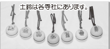
土鈴は各寺社にあります。

●円泉寺には、飯能駅北口より イグルバス宮沢湖・高萩駅・ひだか 団地行で飯能靖和病院前下車 徒歩約15分。又は、タクシー利用。